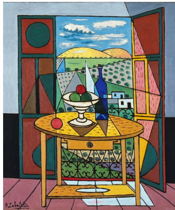
Rafael Zabaleta, Interior y Paisaje . Óleo sobre lienzo