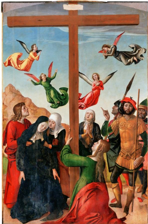
Juan de Borgoña, Cruz en el Calvario . Temple sobre madera.