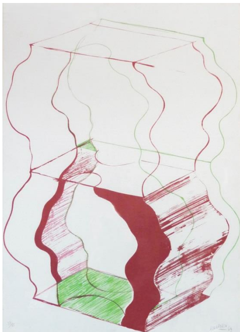
Luis Alexanco, Composición . Litografía