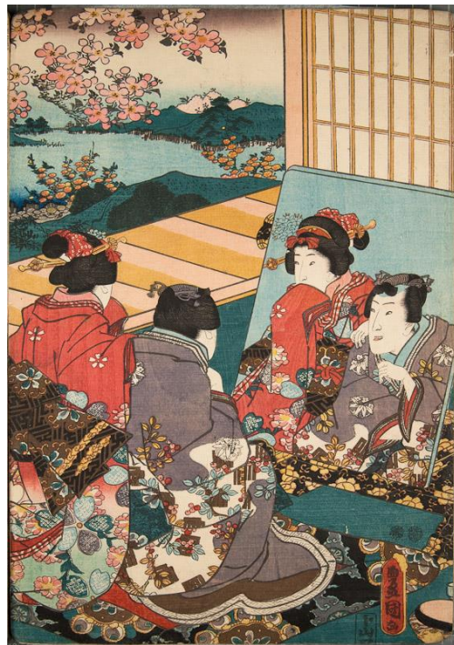
UTAGAWA KUNISADA: [Ukiyo Matahei, considerado el creador del Ukiyo-e]. En: [Nishiki-e: estampas de brocado]. A. 1847-1854, 161 estampas.