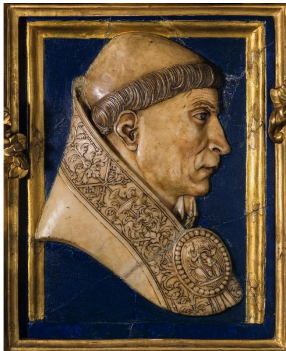
Phillippe Bigarny. El Cardenal Cisneros . Alabastro.

Conservadas en los distintos centros del campus universitario de Moncloa y Somosaguas, se pueden encontrar en esta colección piezas de grandes maestros como Eugenio Cajés, Fortuny, Maella, Madrazo o Benlliure, además del conjunto de aguatinas, xilografías y tintas de origen japonés conservado en la Facultad de Bellas Artes.