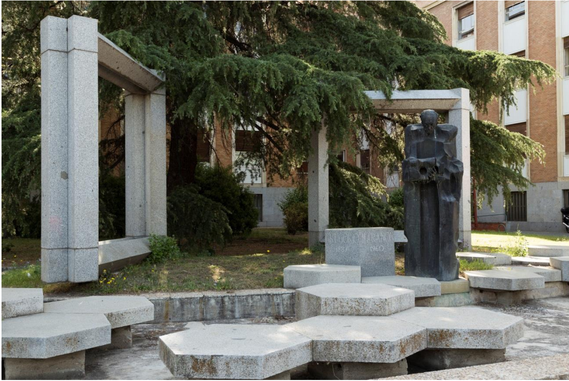
Pablo Serrano, Monumento a Gregorio Marañón . Bronce y Piedra