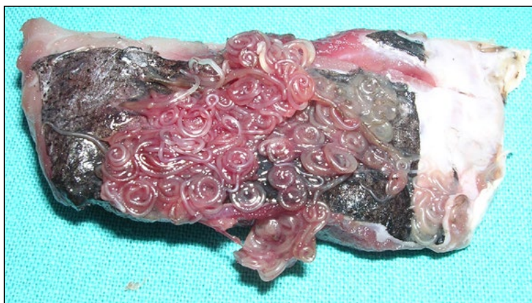
Larvas de anisakis sobre merluza.

Cuando se ingiere un pescado con larvas de anisakis, este produce inflamaciones locales o granulomas –inflamación formada por células inmunes que tratan de eliminar un parásito sin éxito–.