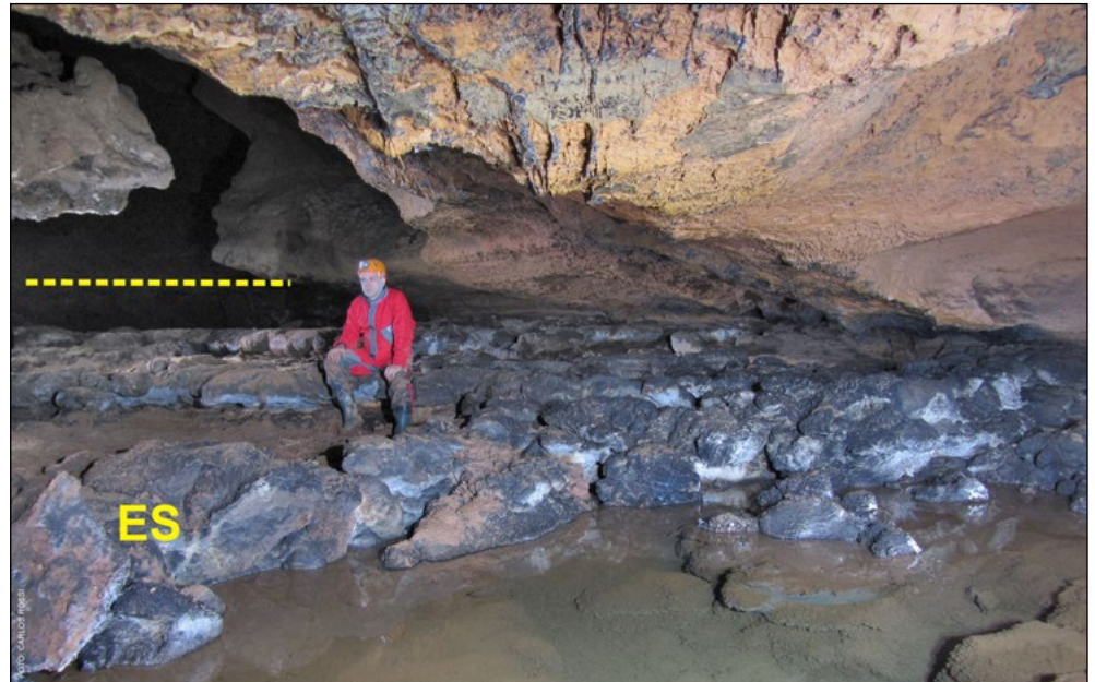
Ejemplo de uno de los niveles de estromatolitos (ES) cartografiados en la cueva de El Soplao. Este lugar en concreto constituye el mejor ejemplo descrito hasta la fecha de espeleo-estromatolitos. La línea horizontal indica la terraza de roca asociada al nivel estromatolítico.

Con los datos geomorfológicos obtenidos en este artículo, los investigadores proponen un modelo contrastado para la formación de la cueva. Previamente, la morfología irregular de las paredes de la cueva hizo pensar en un origen hipogénico, es decir, asociada a aguas de