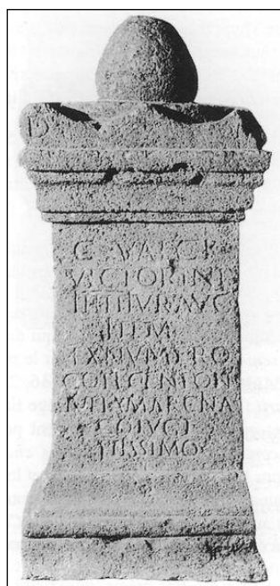
Figura 3. Epígrafe nº 5, inscripción funeraria del seviro augustal Caius Valgius Victorinus .