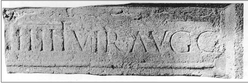
Figura 5. Epígrafe nº 8, inscripción fragmentaria con mención a dos o más seviro augustales.