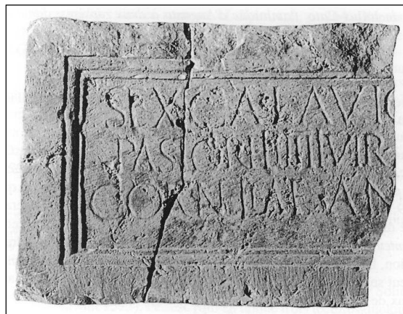
Figura 2. Epígrafe nº 2, inscripción funeraria del seviro augustal Sextus Calavius Pastor .