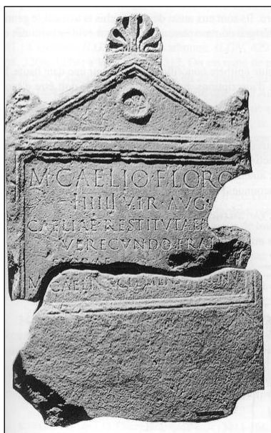
Figura 1. Epígrafe nº 1, inscripción funeraria del seviro augustal Marcus Caelius Florus . Fuente: EDCS .