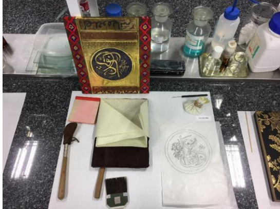
Actividad de 2016 en Bellas Artes.

de dragones de “Aspectos interculturales del mito del dragón” hasta el recorrido por el mercado, la cocina y el banquete de la gastronomía de la Antigua Roma en “Cocina como un romano” , pasando por el manejo de la voz y la lingüística en “Los Detectives de la Lengua” .